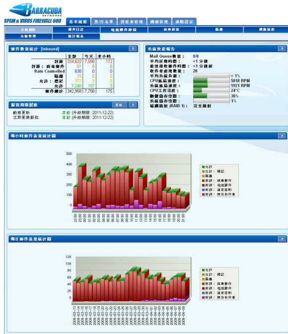
梭子鱼过滤所有邮件信息并且提供邮件是如何被进行处理过滤的相关信息。

梭子鱼产品的安装无需任何软件以及网络改动。规则库升级由梭子鱼中心自动的发送，梭子鱼中心是一个先进的技术中心，工程师24X7一直监控垃圾邮件和病毒的变化，并提供最有效的防护措施。规则库升级包括了最新的垃圾邮件定义库，病毒定义库以及安全规则库，每小时自动的升级能够提供防御最新威胁的能力。